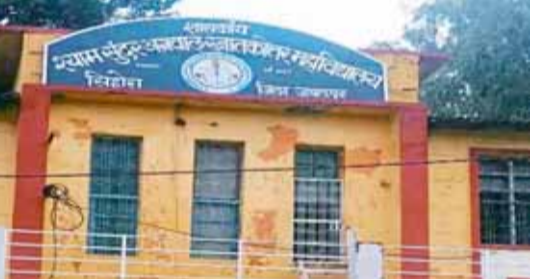
विद्यार्थी उपस्थित हुए इनमें से 6 विद्यार्थियों का चयन लखनऊ ट्रेनिंग

सिहोरा। शासकीय श्यामसुंदर अग्रवाल स्नातकोत्तर महाविद्यालय में कैंपस ड्राइव का आयोजन प्रोडम एम्प्लॉईबिलिटी अकादमी नई दिल्ली एनजीओ द्वारा शुक्रवार को ओपन कैंपस ड्राइव का आयोजन किया गया। इस ड्राइव में ग्रामीण क्षेत्र के विद्यार्थियों को अंग्रेजी, कंप्यूटर अन्य विषयों को पढ़ाया जाने हेतु शिक्षकों का चयन किया गया। इस रोजगार मेले में 30